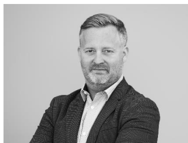
Groupe de base production et né- goce Michael Widmer FREI connect